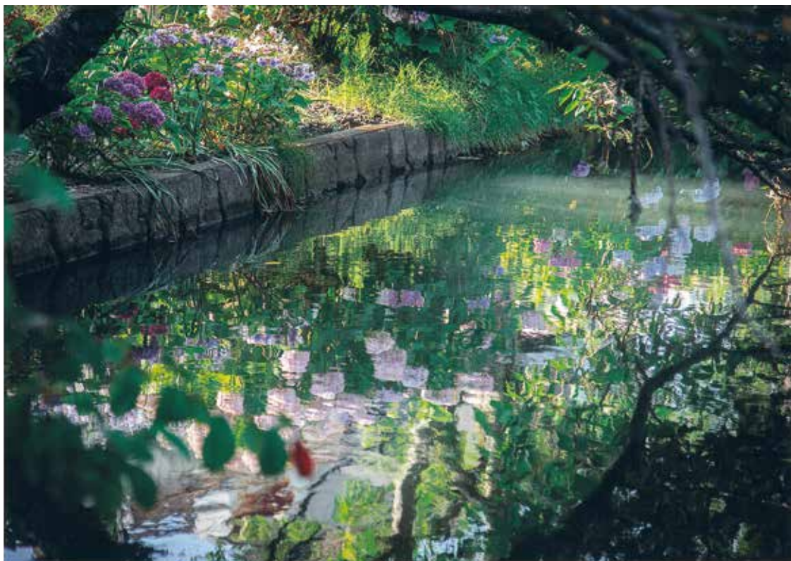
〈写真〉園田 啓矩 (撮影場所:八代市)